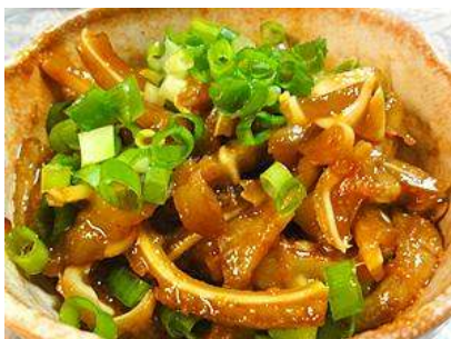
* 豚耳のピリ辛炒め

九州産豚の耳を原料につくりました！！ 手間暇かけて綺麗にお掃除しボイル 一口大にカットしてありますので いろいろなメニューに使えます