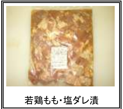
若鶏もも・塩ダレ漬