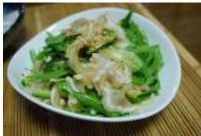
* 豚耳と水菜、きゅうりのサラダ