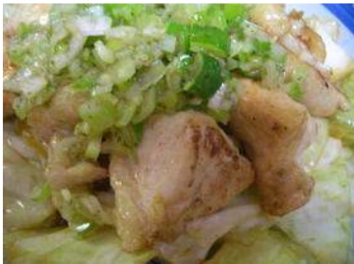
* ネギ塩チキン焼き

一口大の若鶏もも肉を本格派塩ダレで漬け込みました。 焼くだけでヘルシーな鶏もも焼きがご賞味できます。